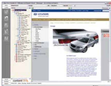
Administrationsoberfläche von contentXXL